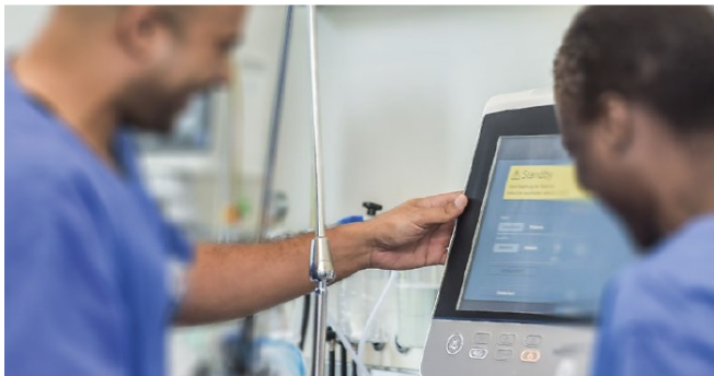
FAQ „Pflegefachkräfte aus dem Ausland für NRW“

Das Wichtigste zu Anerkennungsverfahren und Einreise nach Deutschland (Stand 05/2020)